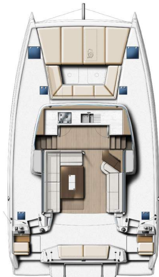
COCKPITS AND SALOON COCKPITS & SALON