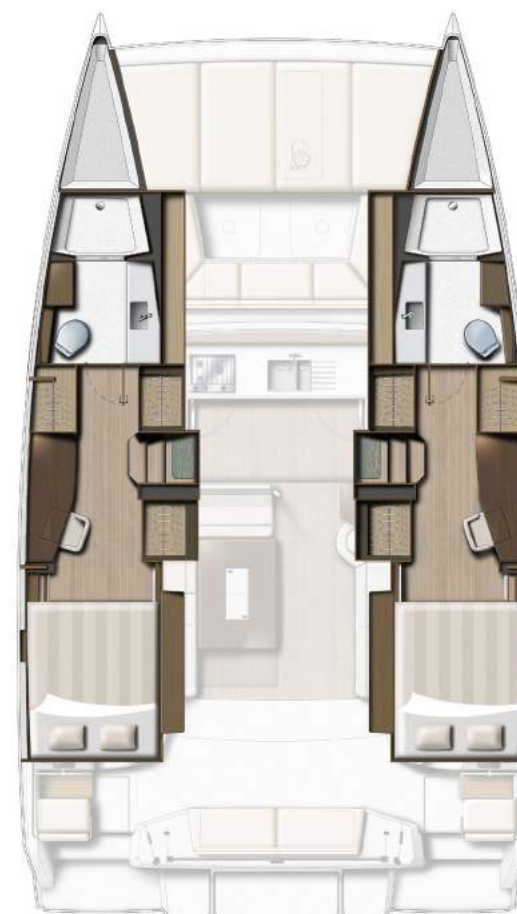
2 DOUBLE CABINS / 2 HEADS VERSION VERSION 2 CABINES DOUBLES / 2 SDB