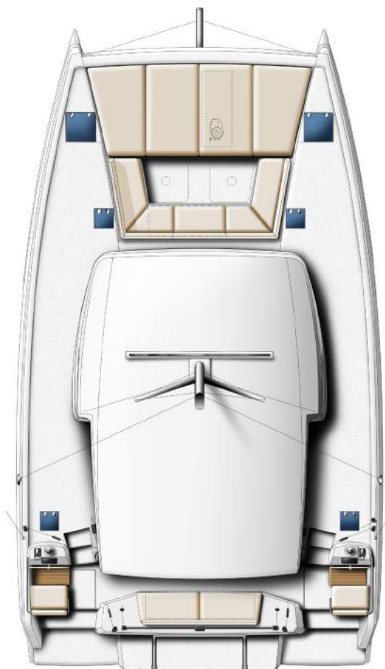
DECK AND FLYBRIDGE PONT & FLYBRIDGE